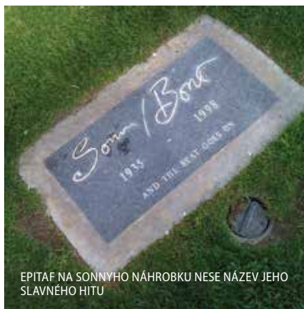
EPITAF NA SONNYHO NÁHROBKU NESE NÁZEV JHO SLAVNÉHO HITU

Cher po rozvodu pokračovala v úspěšné sólové dráze trvající prakticky dodnes; Sonny si otevřel několik restaurací, znovu se oženil, založil novou rodinu a začal kariéru v politice. V roce 1988 se stal starostou kalifornského Palm Springs, v roce 1994 pak kalifornským senátorem za republikány. Proslul jako politik, co si ze sebe neváhal dělat legraci – podobně jako na pódiu ve dvojici s Cher, v níž hrál vždy toho hloupějšího.