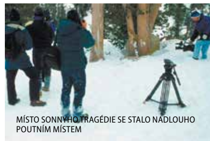
MÍSTO SONNYHO TRAGÉDIE SE STALO NADLOUHO POUTNÍM MÍSTEM

Osobně bych si takovou okamžitou smrt při něčem, co miluju, považoval hodně vysoko. Hned vedle skonou při odpoledním šlofiků anebo při sexu, nejlíp dobrovolném. Noste přílby!