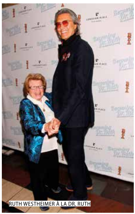
RUTH WESTHEIMER A LA DR. RUTH